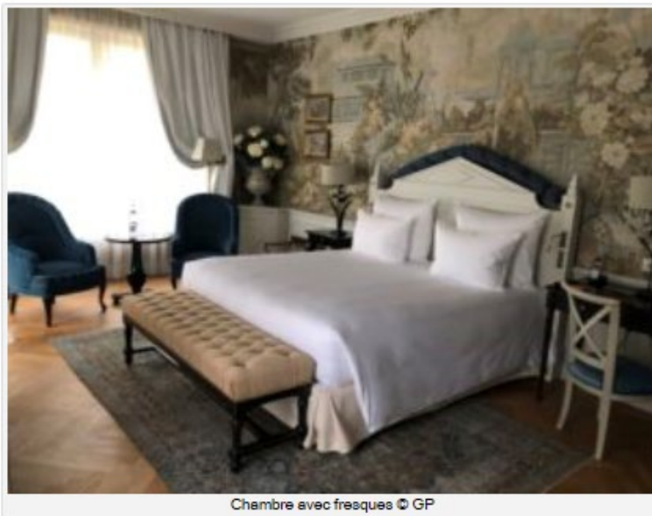
Chambre avec fresques

Il y a 34 chambres et suites, de beaux salons sur le mode ancien, des escaliers en fer forgé, une vaste salle à manger avec son toit en zinc sur le mode Second Empire et son haut plafond en stucs. 37 corps de métiers, dont la plupart labellisés « Patrimoine Vivant » - doreurs, ébénistes, tapissiers et zingueurs - ont travaillé d'arrache-pied durant deux ans pour créer ce lieu étonnant et neuf qui paraît avoir été depuis trois siècles.