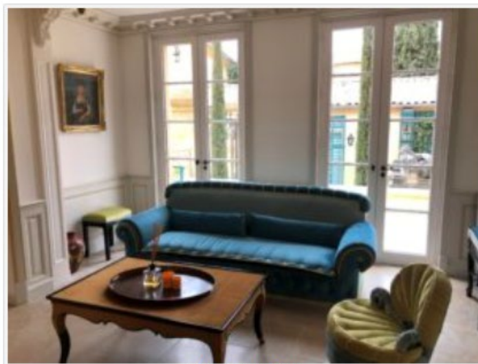
Salon d'accueil