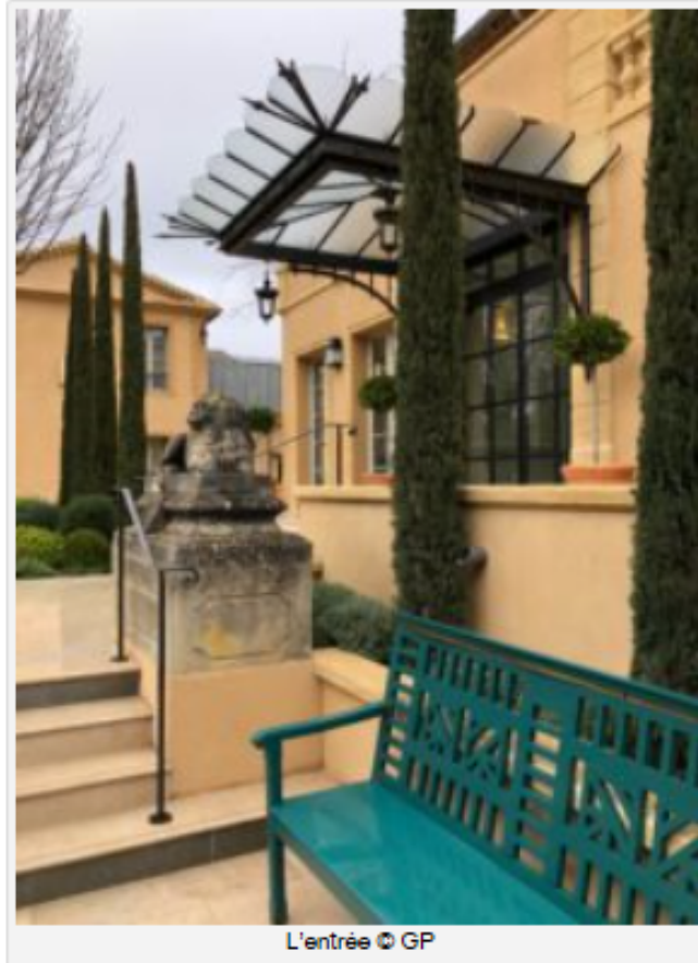
L'entrée