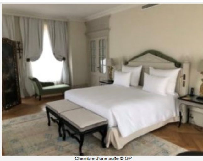
Chambre d'une suite