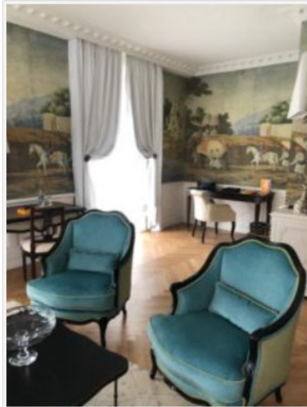
Salon d'une suite avec fresques