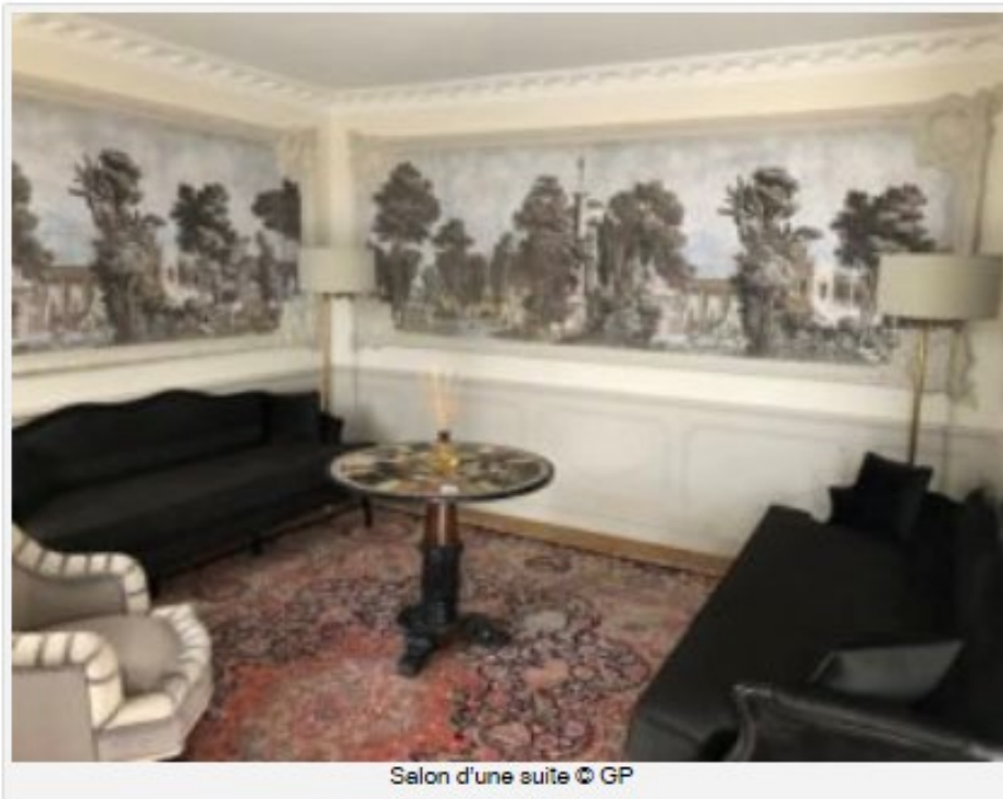
Salon d'une suite

Il y a 34 chambres et suites, de beaux salons sur le mode ancien, des escaliers en fer forgé, une vaste salle à manger avec son toit en zinc sur le mode Second Empire et son haut plafond en stucs. 37 corps de métiers, dont la plupart labellisés « Patrimoine Vivant » - doreurs, ébénistes, tapissiers et zingueurs - ont travaillé d'arrache-pied durant deux ans pour créer ce lieu étonnant et neuf qui paraît avoir été depuis trois siècles.